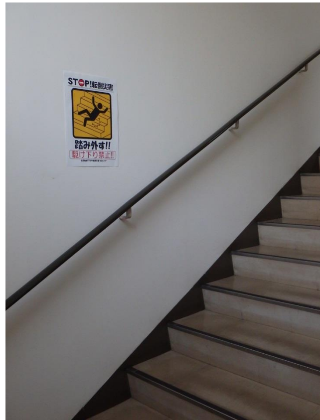
—「踏み外し」危険場所に注意喚起—

上記写真の注意喚起表示は、白河労働基準協会のホームページからダウンロードして使用することができます。(ホームページアドレスは最終ページ参照)