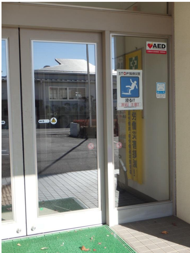
—「滑り」危険場所に注意喚起—