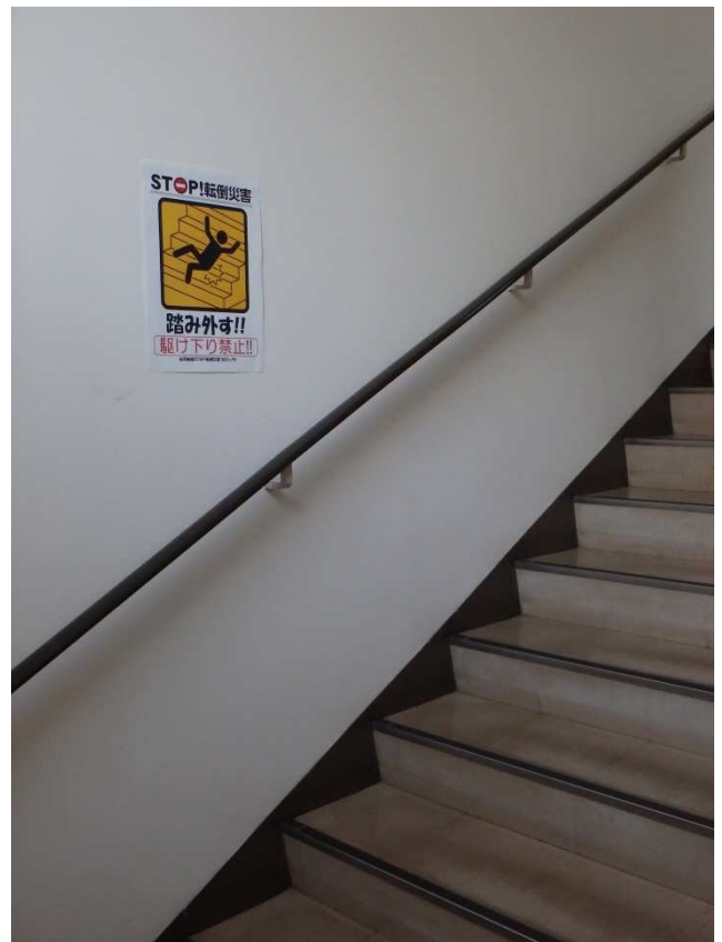
- 「踏み外し」危険場所に注意喚起 -

上記写真の注意喚起表示は、白河労働基準協会のホームページからダウンロードして使用することができます。(ホームページアドレスは最終ページ参照)