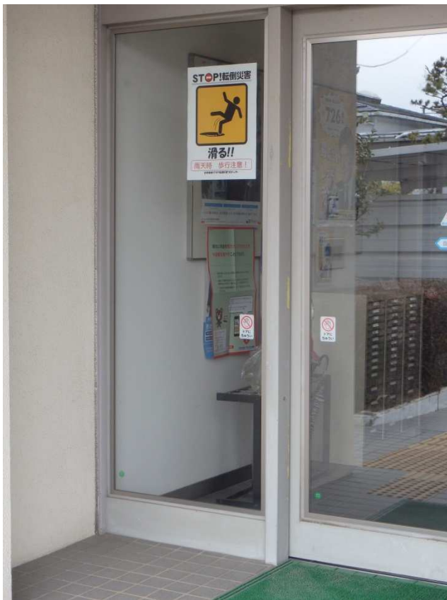
- 「滑り」危険場所に注意喚起 -